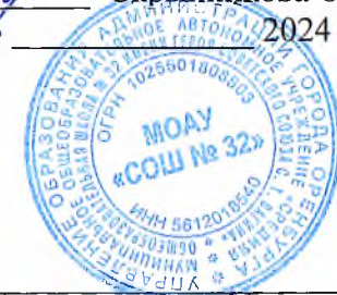
График дежурства администрации МОАУ «СОШ № 32»